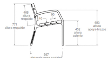
vista lateral 1:20